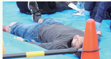
医療機関（DMAT）によるトリアージ