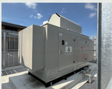
非常用発電（72時間発電）