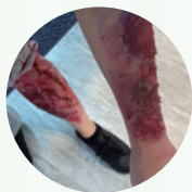
負傷者への外傷・火傷などを模したムラージュや演技指導で臨場感増大

消防、警察、DMAT、地域住民、クロスウェイなかもち職員などによる『消防訓練』を実施。駅内レストランからの出火を想定し、災害対応訓練（指揮所の開設を含む）を行いました。ブラインド型で実施した今回の緊迫感溢れる訓練では、火災発生時の危険性を認識し、安全に対する意識を高めることができました。