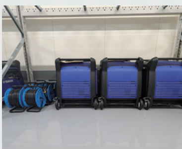
携帯発電機・電工リール