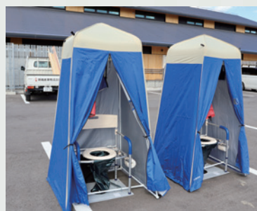
マンホールトイレ